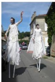
Prendre de la hauteur