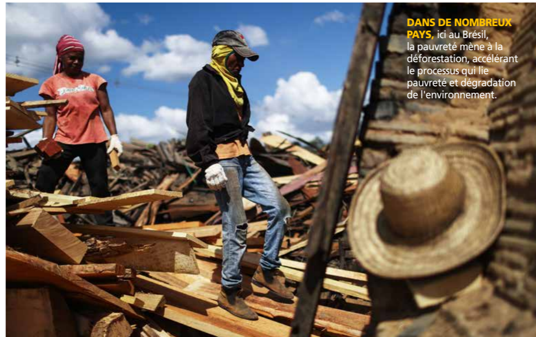
DANS DE NOMBREUX PAYS , ici au Brésil, la pauvreté mène à la déforestation, accélérant le processus qui lie pauvreté et dégradation de l'environnement.

Le secteur public est confronté au problème de gestion de l'environnement. Réunir les informations pour une prise de décision efficace est coûteux. Les motivations des politiciens et des