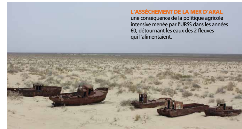
L'ASSÈCHEMENT DE LA MER D'ARAL , une conséquence de la politique agricole intensive menée par l'URSS dans les années 60, détournant les eaux des 2 fleuves qui l'alimentaient.