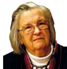
ELINOR OSTROM (1933-2012)

« Des dizaines d'années de recherche montrent qu'un éventail de mesures évolutives, complémentaires au niveau urbain, régional, national et international a plus de chance de réussir qu'un accord universel et contraignant, car il permettrait de disposer d'un recours en cas d'échec de certaines de ces mesures. »