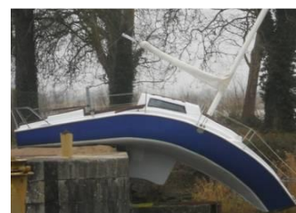
... oser aller plus loin

Débat mouvant : faire émerger et partager des positions argumentées à partir d'affirmations clivantes autour des deux sujets de la rencontre