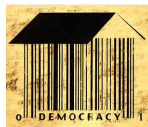
Vers une démocratie plus démocratique ?