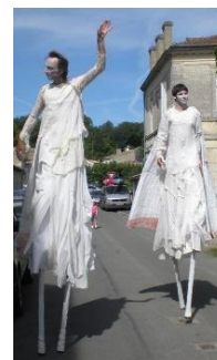
Prendre de la hauteur

Philosophe et professeur à l'Université de Lausanne